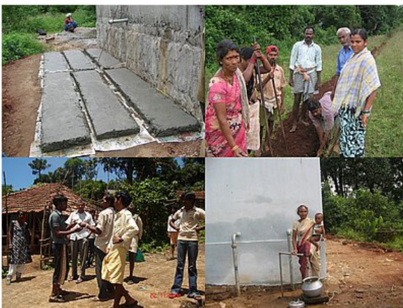
Completion of Construction Work at Rintada